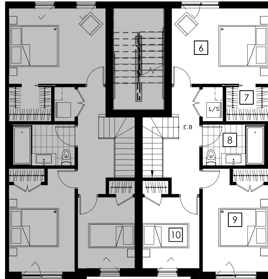
ÉTAGE 2 Second Floor