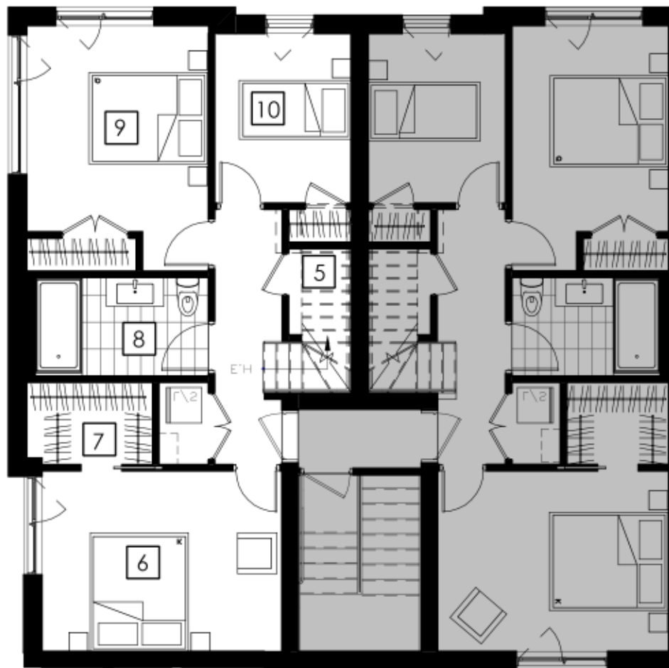
ÉTAGE 3 Third Floor