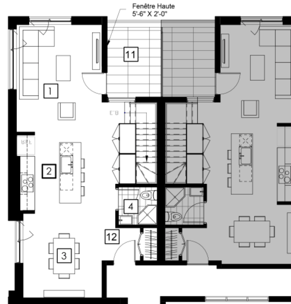
ÉTAGE 4 Fourth Floor