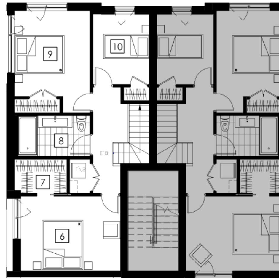
ÉTAGE 2 Second Floor