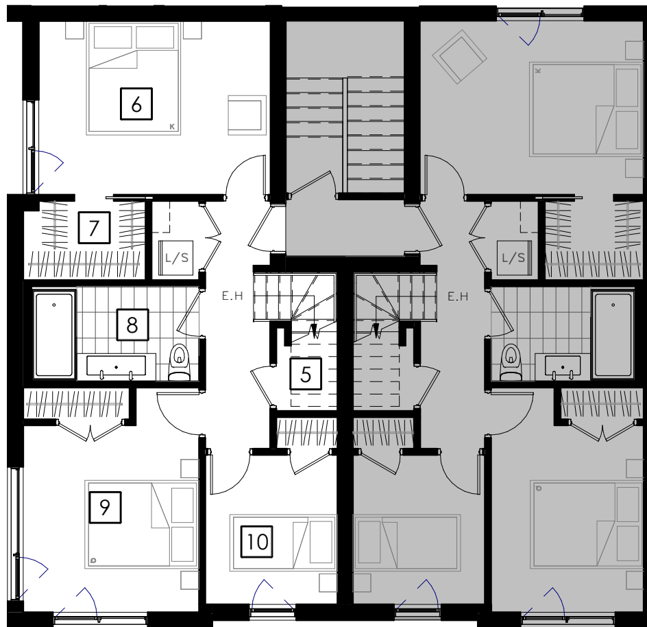
ÉTAGE 3 Third Floor