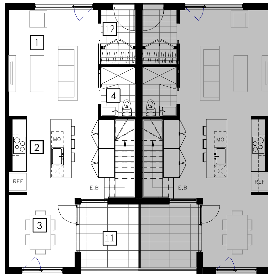
ÉTAGE 4 Fourth Floor