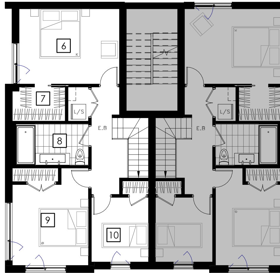
ÉTAGE 2 Second Floor