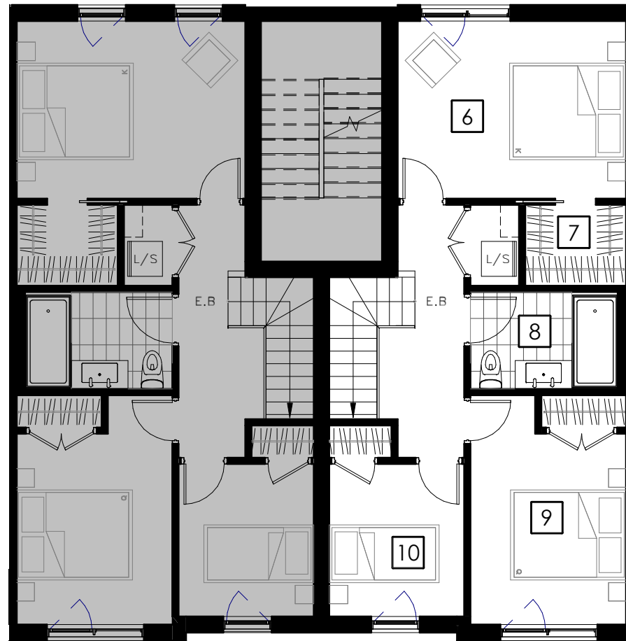
ÉTAGE 2 Second Floor