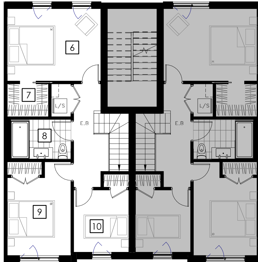
ÉTAGE 2 Second Floor